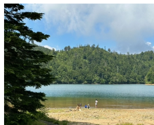
ユネスコパークの大沼池