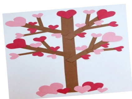
MY VALENTINE TREE