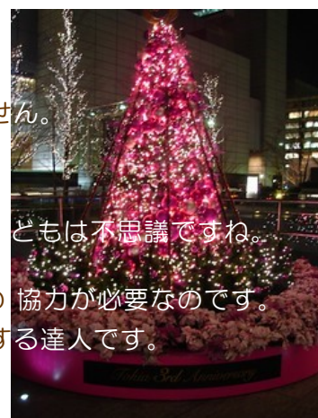
子どもは不思議ですね。協力が必要なのです。る達人です。